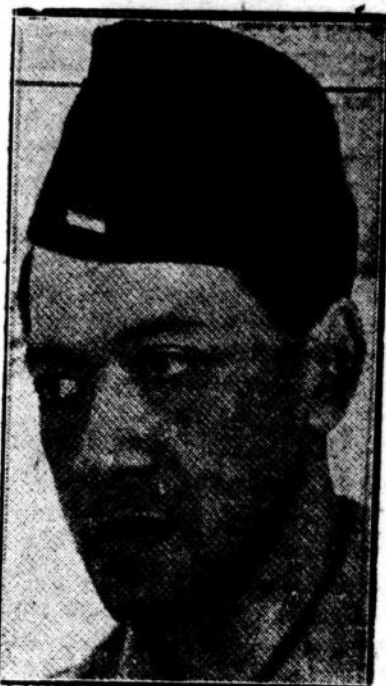
Sri Sultan Hamengku Buwono IX